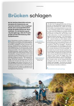
Publireportage Einzelseite / Chuchichästli