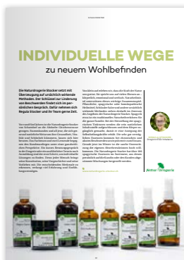
Schaufenster / Kaleidoskop