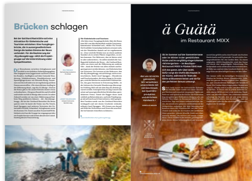
Publireportage Einzelseite / Chuchichästli