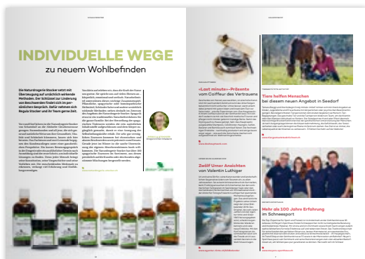
Schaufenster / Kaleidoskop