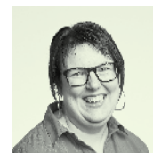
Fränzi Stalder Konzepte, Texte und Projektleitung